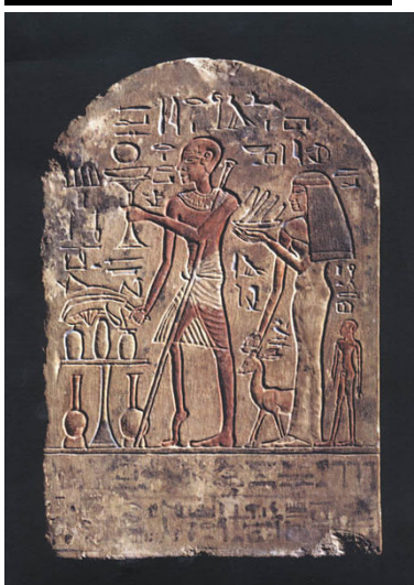
Древна египетска стела от 18-та династия, изобразяваща жертва на полиомиелита.