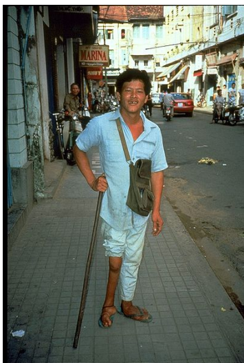
Човек с атрофирал десен крак поради полиомиелит.