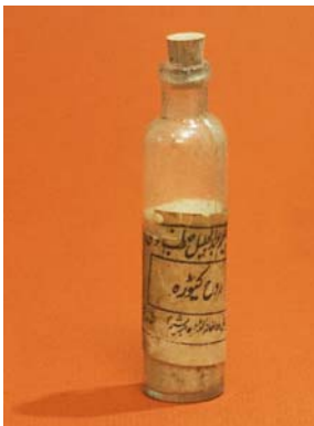
- Запазен материал съдържащ вируси за инокулация, от Индия.

Още диви и варварски племена са практикували ИНОКУЛАЦИЯ, известна още като ВАРИОЛАЦИЯ. Практикувала се е в Индия още от 1000г. пр. н. е. Представлява натъркване на прах от изсъхнали струпеи и лезии на болен, върху нарочно направена раничка на здрав. По-късно се практикува и в Китай. Постепенно и в Англия, Османската империя, Африка, Европа. Смъртността била в рамките на 0,5 – 2%. Това е значително много по-малък процент от смъртността при естествен ход на заболяването. По време на престоя си в Османската империя Лейди Мери Монтегю, наблюдава как населението прилага инокулация. Този процес тя подробно описва в писмата си и след завръщането си през 1718 ентусиазирано насърчава процедурата да се прилага и в Англия.